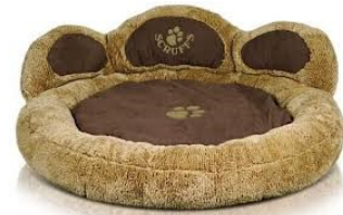
سرير فاخر للحيوانات الأليفة، $60