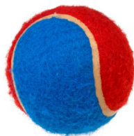
طابة تنس، $2