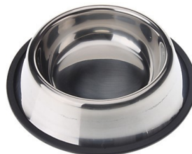
أوعية معدنية، $20/طقم