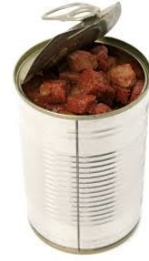
طعام لّين، $10 (إختياري)