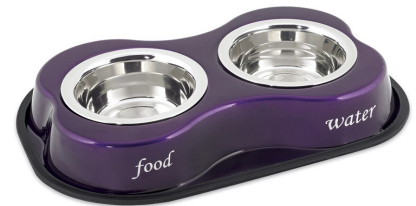
أوعية فاخرة، $40/طقم