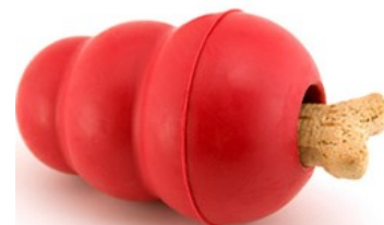
لعبة الكلب "كونغ"، $10