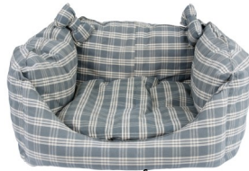
سرير أساسي للحيوانات الأليفة، $25