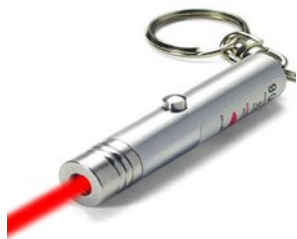
مؤشرة الليزر، $15