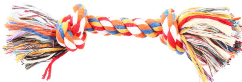
لعبة حبل عادية، $8