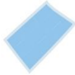
حفاضات الجرو، $20 (مطلوبة إذا ما اخترت جرواً)