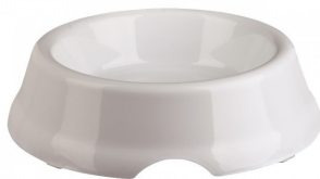
أوعية بلاستيكية، $10/طقم