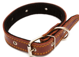
طوق جلدي، $15