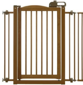
بوابة حيوان أليف، $50