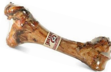
عظم حقيقي للكلاب، $20