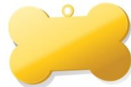
عظمة ذهبية، $20