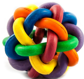
طابة نطاطة، $7