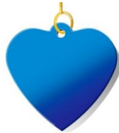
قلب أزرق، $10