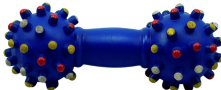
لعبة زقاقة، $5