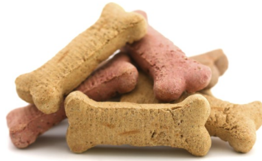
وجبة طعام خفيفة، $5 (إختياري)