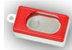
*مقرقة، $3 (مطلوبة للمساعدة في تمرين الكلب)