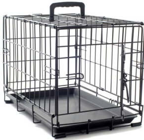
قفص: كلب صغير أو جرو: $40 كلب كبير: $60