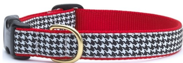
طوق قماشى، $7