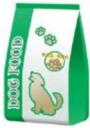
*طعام جاف، $25