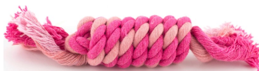
لعبة الحبل المجدول، $17