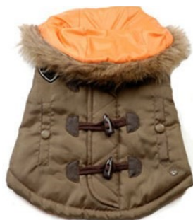
معطف شتائي، $25