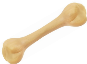
عظم بلاستيكي، $5