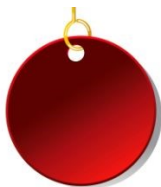
دائرة حمراء، $5