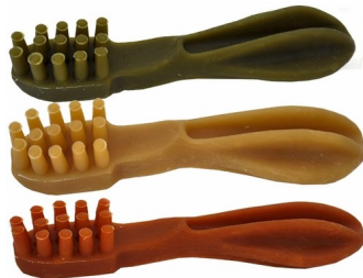
عضاضات للأسنان، $10